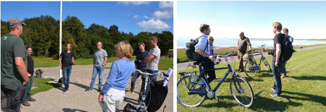
Foto's: Landschapsarchitecten van bureau Lama in gesprek met onder andere (vertegenwoordigers van) boeren, gemeente, projectleider biodivers boeren, Wetterskip Fryslan, Rijkswaterstaat en Natuurmonumenten.

De grootste uitdaging van de 21 e eeuw is de verandering van het klimaat. Klimaatverandering daagt ons uit om anders te kijken naar onze omgeving. Een ontwerp bureau werkt op dit moment aan een klimaatadaptief ontwerp voor Schiermonnikoog. Zij doen dit in opdracht van het Global Center on Adaptation in Groningen (adaptatiecentrum). In september kwamen de ontwerpers naar Schiermonnikoog en spraken met verschillende mensen over onder andere (hoog) water, droogte en verzilting.