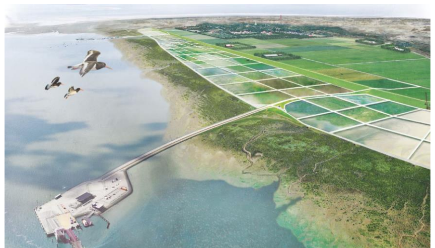
Nieuwe Waddenrand. Afbeelding LAMA landscape architects

Het hele ontwerp is te lezen in een online boekwerk (ook op de site). Het is geen streefbeeld voor de toekomst, maar kan mogelijk wel inspireren. De ontwerpers hebben aangegeven graag een keer in gesprek te gaan met inwoners over het door hen opgestelde toekomstbeeld. Dit zal eventueel plaatsvinden als de coronamaatregelen dit weer toelaten.