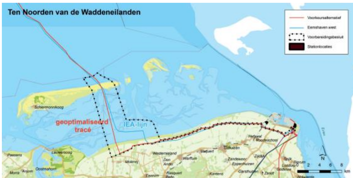
Afbeelding van voorbereidingsbesluit Eemshaven West (zoekstrook) inclusief de twee opties voor een transformatorstation.

Op onze website kunt u nogmaals het regioadvies lezen. Ook vindt u hier het antwoord van het ministerie van EZK op het regioadvies en het nieuwsbericht van het ministerie. Tot slot kunt u de brief bekijken die het collega deze week aan de gemeenteraad stuurde over dit onderwerp. U vindt deze extra informatie bij de nieuwsberichten op onze website.